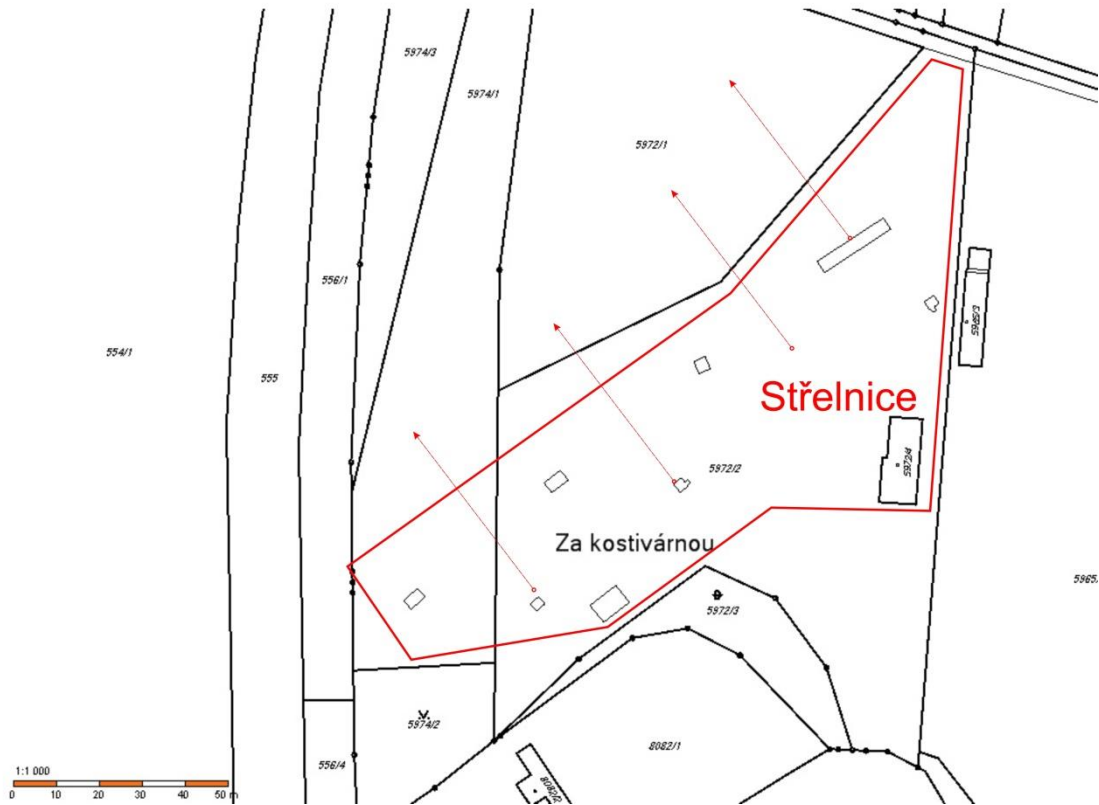
Obrázek 1 - Poloha střelnice na snímku pozemkové mapy